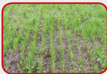
Tijdens Vredo (Dag 13)