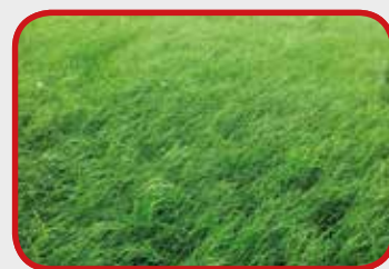
Na Vredo (Dag 31)